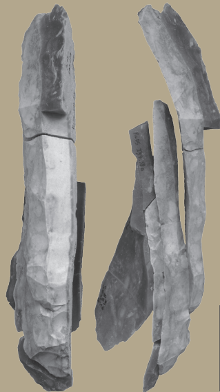
Débitage laminaire du haut niveau de savoir-faire

C2RMF - Palais du Louvre - Porte des Lions 14 Quai François Mitterrand 75001 Paris, France.